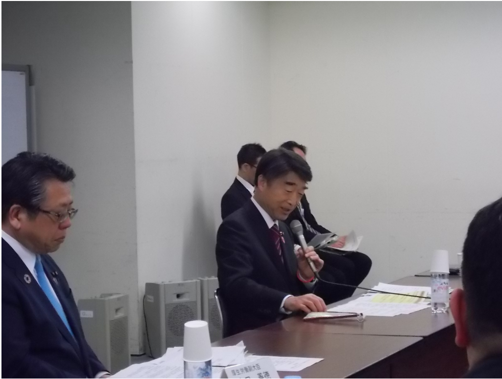
根本匠厚生労働大臣 大口善徳厚生労働副大臣